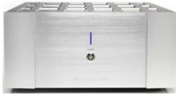
YMER mk II