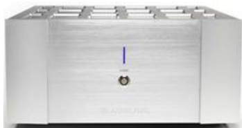
YMER mk II